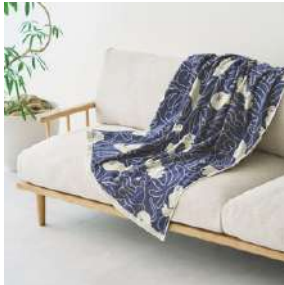
컬러 : 카멜 / 네이비