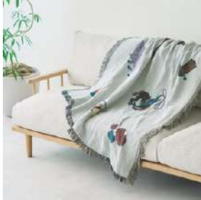
컬러 : 오렌지 / 민트